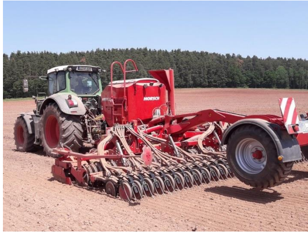
GETREIDEAUSSAAT mit Horsch Pronto KR6 Kreislege, 6m Arbeitsbreite-Scheibenschar mit Andruckrolle