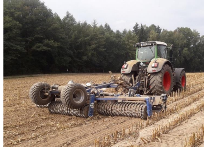
DalBo MESSERWALZE 6,30m zur schnellen Maisstoppelbearbeitung / Maiszünslerbekämpfung