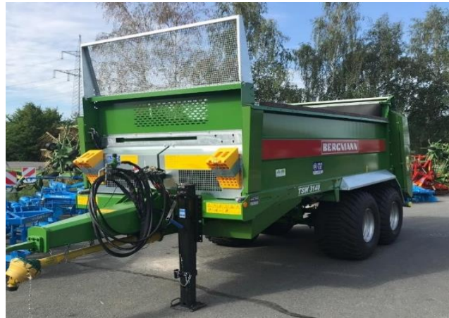
KOMPOSTSTREUER - MISTSTREUER Arbeitsbreite 20-30 Meter, Breitreifen, Gewicht 14 to ges. Gew.Fabrikat Bergmann 31/40 Tellerstreuwerk